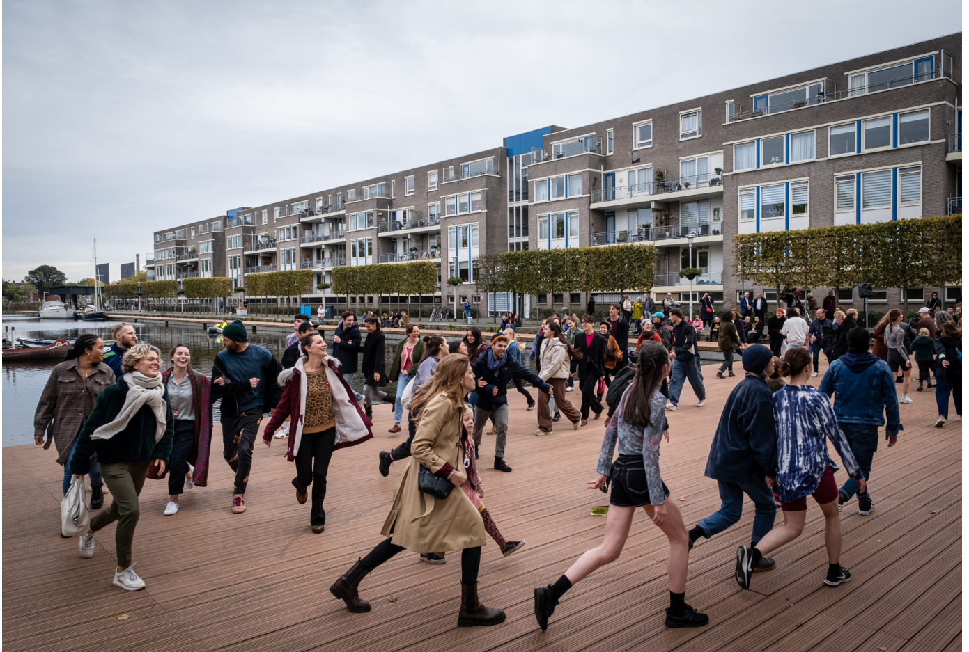
• Het evenement Dansjacht op 1 oktober met elf pop-up performances in de publieke ruimte kwam feestelijk ten einde toen een 200-tal performers en enthousiaste toeschouwers samen over de kop van de Tilburgse Puihaven huppelden.