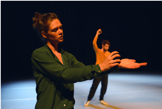
While We Strive door Arno Schuitemaker

In 2015 is met terugwerkende kracht vanaf 1 januari 2014 aan Stichting DansBrabant de ANBI status verleend.