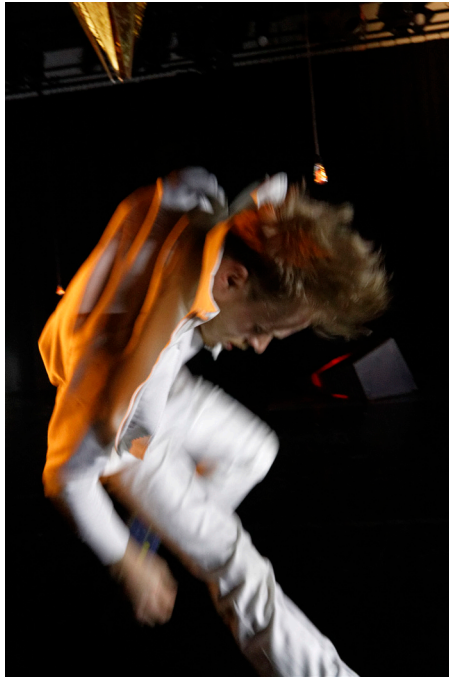
Rise Up door Guilherme Miotto, foto © Robert Benschop

'Vanuit zijn eigen radicale integriteit maakt hij voorstellingen met een zeer eigen, tegendraadse vorm. Als onontkoombare poëzie, rauw en delicaat tegelijkertijd. Hij maakt het zichzelf, zijn dansers en ons, het publiek, niet gemakkelijk. Maar zijn werk is puur en raakt. Het is oprecht en uniek.' Juryrapport André Gingras Award Guilherme Miotto