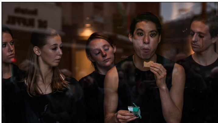
Redesigning Spaces guerilla-project, performance van Katja Heitmann, foto © Amat Bolsius

zonder de argeloze voorbijganger daarbij ongevraagd de verantwoordelijkheid te geven om als publiek te dienen. Het is een intensieve week waaruit we veel inspiratie putten.