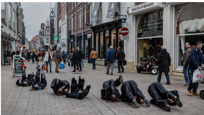
Redesigning Spaces guerilla-project

Om beter en drempelverlagend te communiceren met (potentieel) publiek werd in 2015 het project Hedendaags schrijven over hedendaagse dans uitgevoerd: een cursus van DansBrabant i.s.m. Domein voor Kunstkritiek naar een idee van Dirk Verhoeven met financiële steun van Prins Bernhard Cultuurfonds Noord-Brabant en bkkc impuls gelden en steun van DansMagazine. Tien aanstormende cultuurjournalisten volgden een cursus onder leiding van mentoren uit de journalistiek, filosofie, fotografie en theater. Startend bij het DansBrabant DansDrieluik op Theaterfestival Boulevard, met maandelijks cursusavonden, eindigend tijdens Moving Futures Festival - Editie Tilburg. Cursisten bezochten voorstellingen, repetities, de Dansguerilla en festivals, namen deel aan een dansworkshop en schreven vanuit open vizier essays, fotografische nouvelles en andere nieuwe tekstvormen. Geen recensies, geen sterren, maar nieuwe woorden om te schrijven over vernieuwende dans. In 2016 volgt een publicatie en worden nieuwe (deel-)projecten opgezet met deze club cultuurjournalisten die vragen om méér, een nieuwe generatie van denkers en schrijvers over dans die de brug weten te slaan van maker naar publiek.